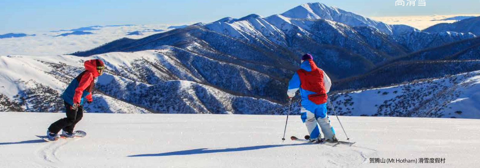
贺腾山 (Mt Hotham) 滑雪度假村