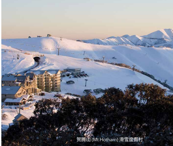
贺腾山(Mt Hotham)滑雪度假村